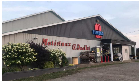
@materiauxgouellet · Matériaux de construction

518, Rang 7 Est Saint-Damase-De-Matapédia (Québec) G0J 2J0 Tél: (418) 776-2222