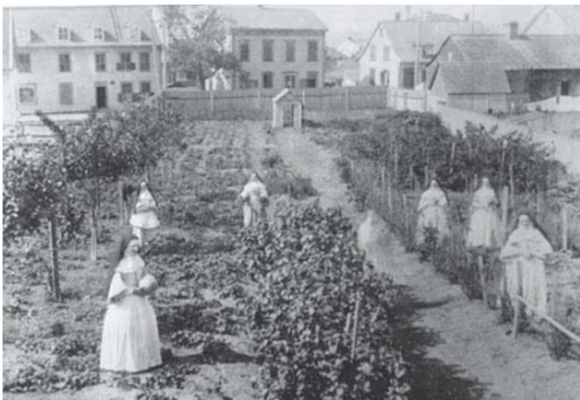
Le jardin médicinal de l'Hôtel-Dieu de Québec, au temps de la colonie.