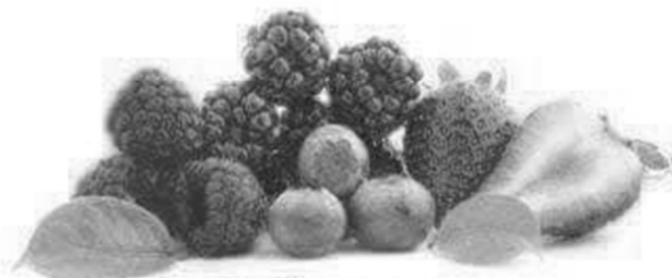
4 Les fruits rouges