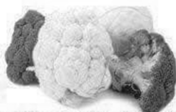
Les Choux et le Brocoli